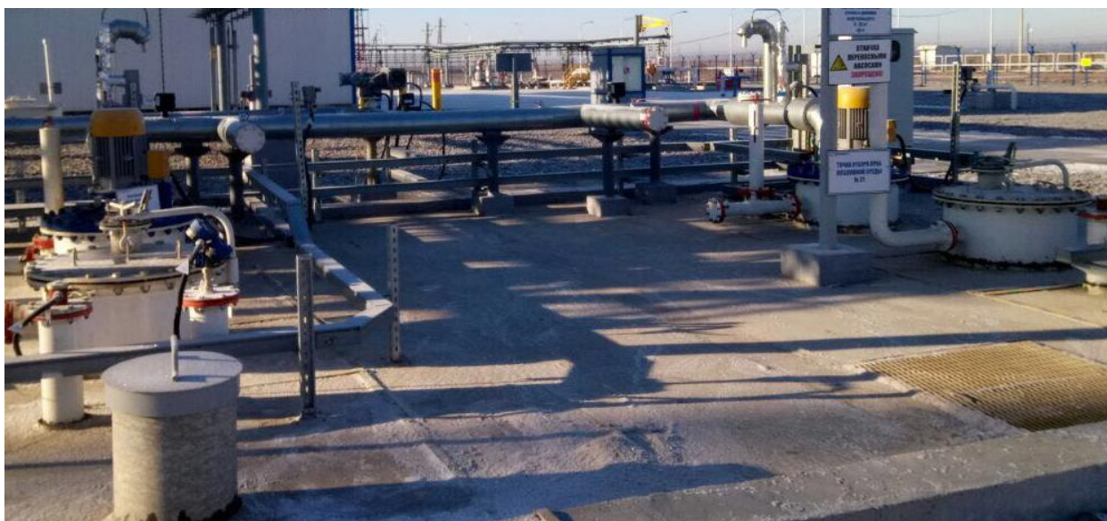
Рисунок 1 - Общий вид места установки резервуаров стальных горизонтальных цилиндрических РГС-20 зав. №№ 59077, 59078

Общий вид места установки резервуаров стальных горизонтальных цилиндрических РГС-20 представлен на рисунке 1. Эскиз резервуаров стальных горизонтальных цилиндрических РГС-20 представлен на рисунке 2.