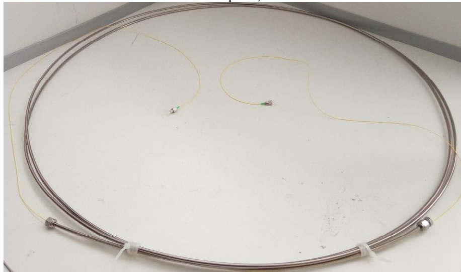
Рисунок 3 – Общий вид волоконно-оптического кабеля системы