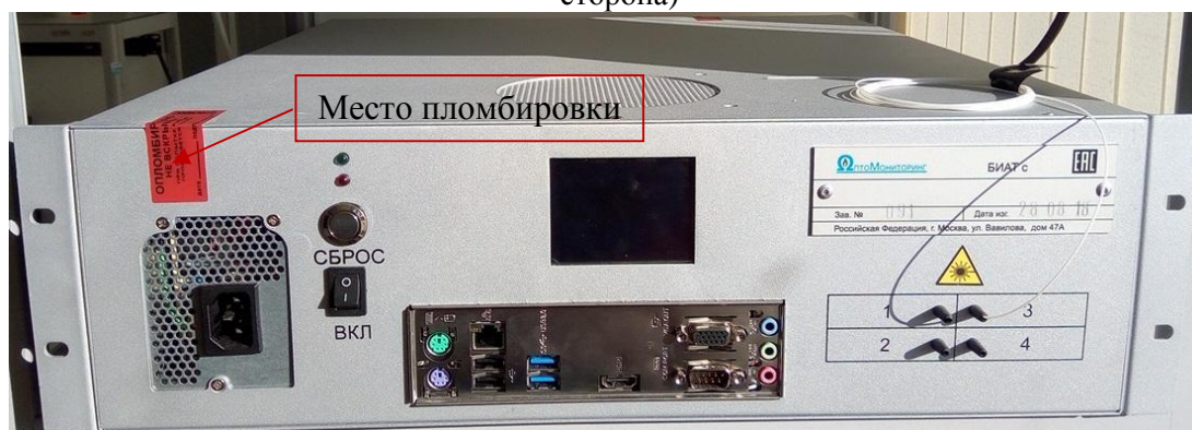
Рисунок 2 – Общий вид блока опроса БИАТ с производства ООО «ОптоМониторинг» (лицевая сторона)