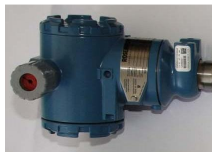
в) преобразователь давления, перепада давления