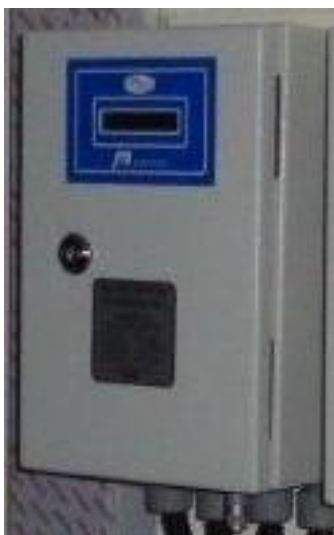
а) вычислитель, установленный в шкафу