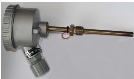
б) преобразователь температуры