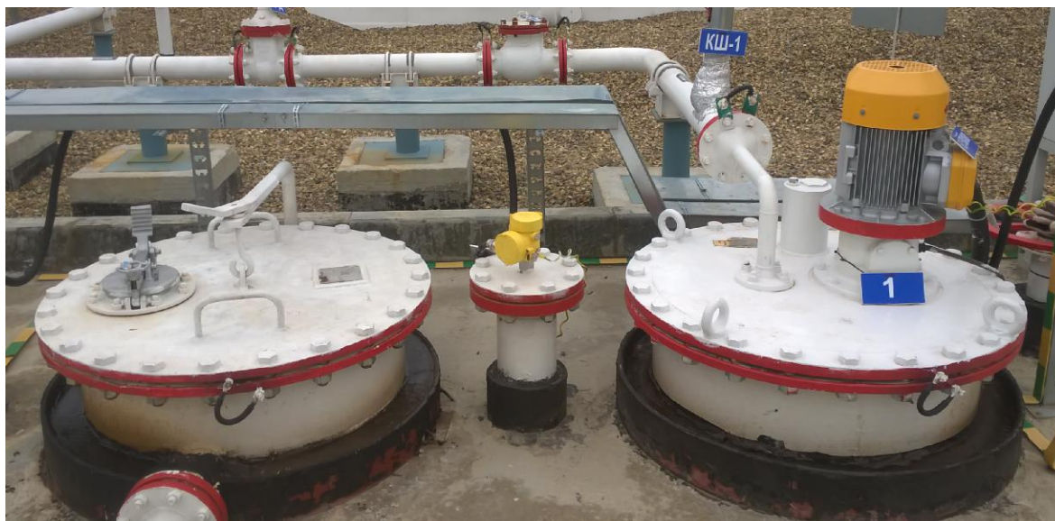
Рисунок 1 - Общий вид места установки резервуара стального горизонтального цилиндрического РГС-12,5 зав. № 38

Общий вид места установки резервуара стального горизонтального цилиндрического представлен на рисунке 1. Эскиз резервуара стального горизонтального цилиндрического представлен на рисунке 2.