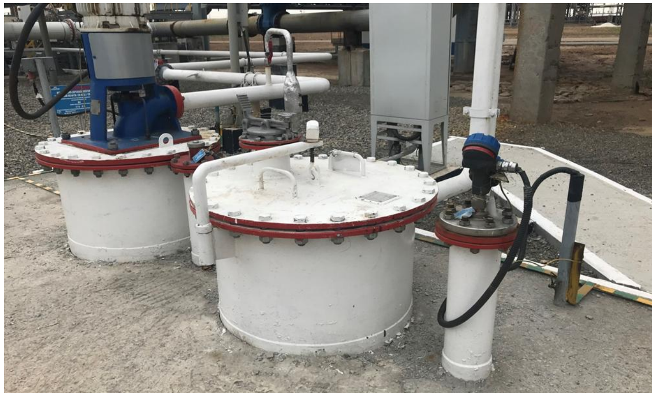
Рисунок 1 - Общий вид места установки резервуара

Общий вид места установки и эскиз резервуара стального горизонтального цилиндрического РГС-25 № 25 представлены на рисунках 1-2.