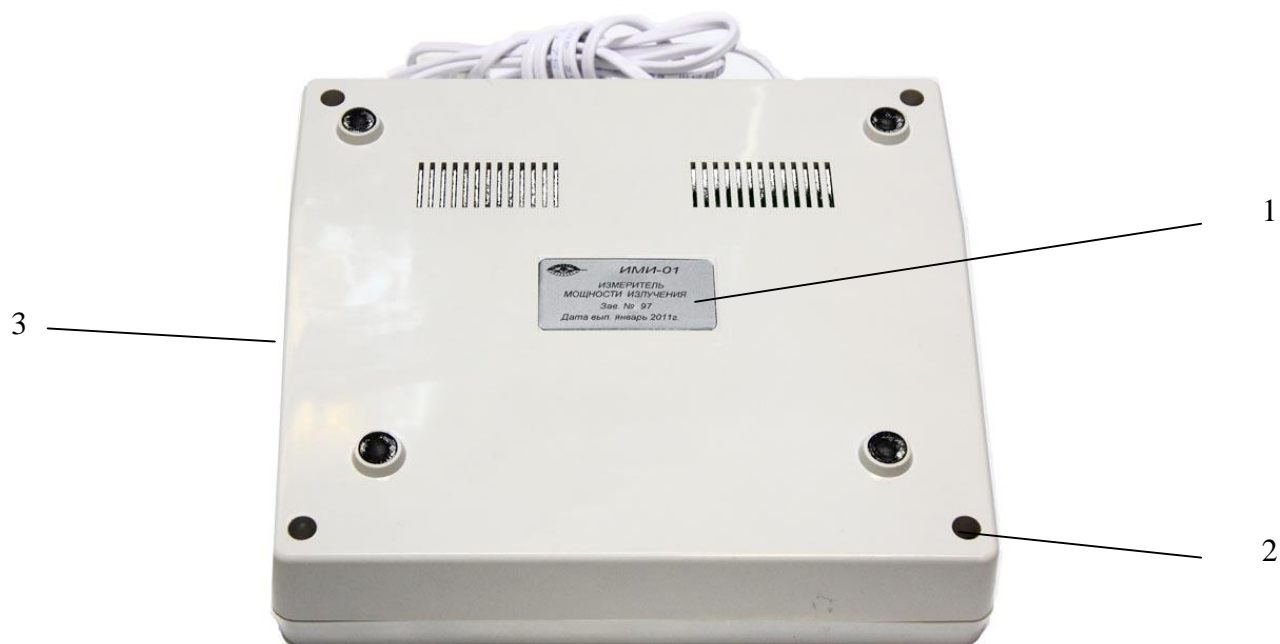
Рисунок 2 - Схема пломбирования, нанесения знака поверки и маркировки измерителя 1 - место нанесения маркировки; 2 – место установки пломбы; 3 – место нанесения знака поверки