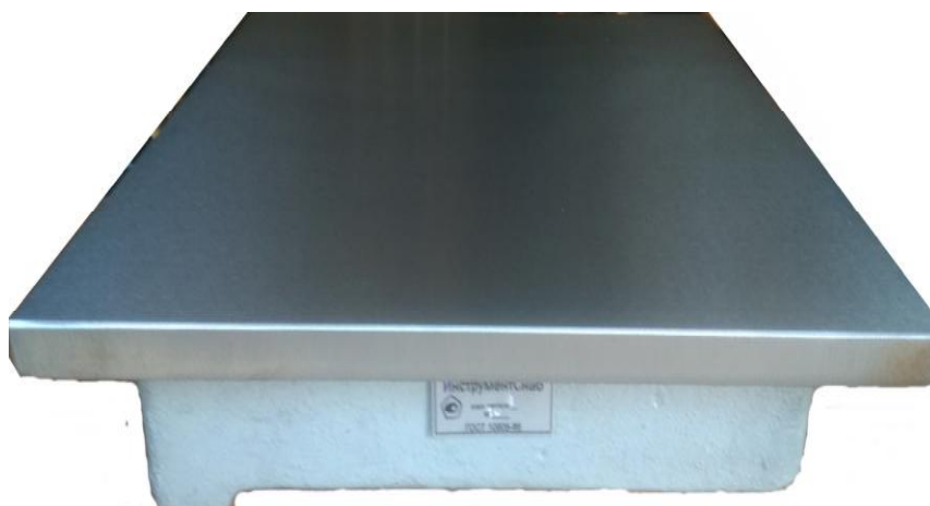
Рисунок 2 – Общий вид плит поверочных и разметочных чугунных исполнения 2

Пломбирование плит поверочных и разметочных чугунных не предусмотрено.