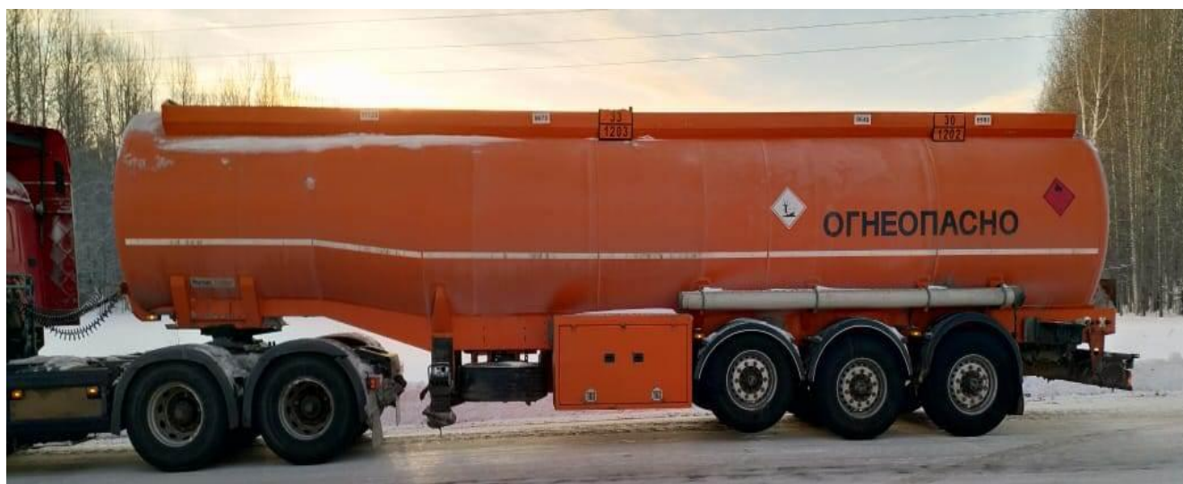
Рисунок 1 - Общий вид полуприцепа-цистерны NURSAN 3ANRS2

Схема пломбировки от несанкционированного изменения положения указателя уровня налива, обозначение места нанесения знака поверки представлена на рисунке 2.