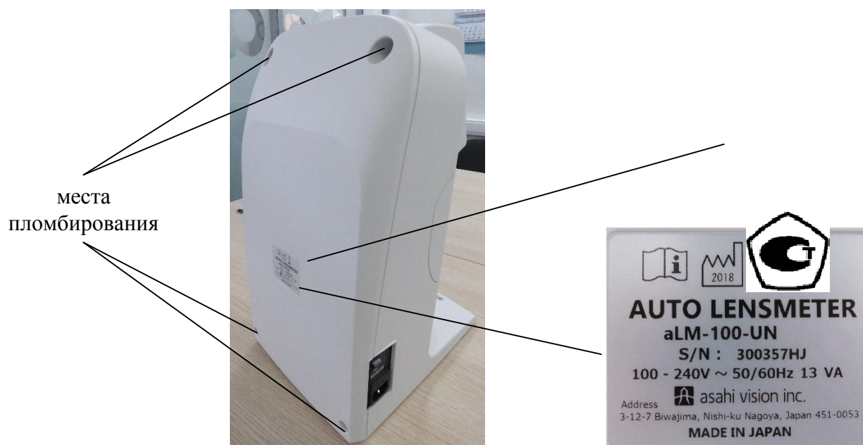
Рисунок 2 – Схема пломбирования от несанкционированного доступа и схема маркировки диоптриметров