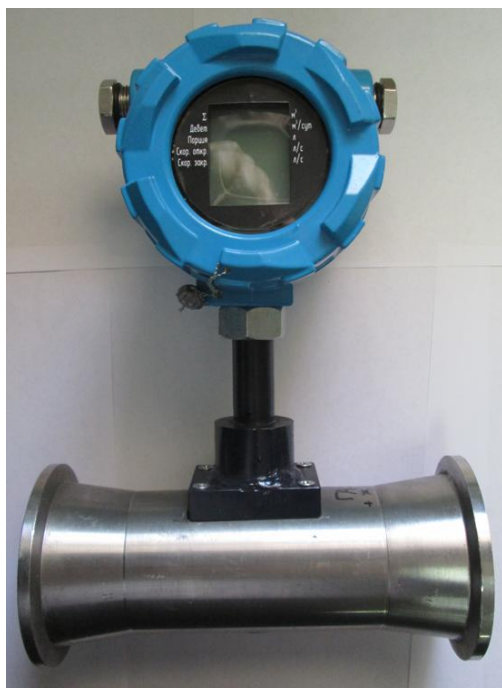
Рисунок 1 – Общий вид расходомеров-счетчиков вихревых ЭРВИП.НТ.ППД