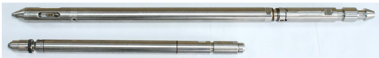
Рисунок 3 – Общий вид манометров-термометров скважинных автономно-кабельных Литан-АК28 и Литан-АК25Г