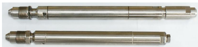
Рисунок 4 – Общий вид манометров-термометров скважинных кабельных Литан-К25Г (газоустойчивого) и Литан-К25С30 (сероводородостойкого)