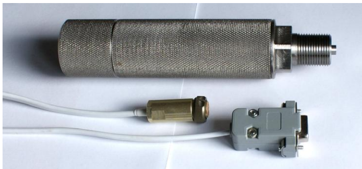
Рисунок 1 – Общий вид манометра-термометра Литан-У (устьевого) с кабелем