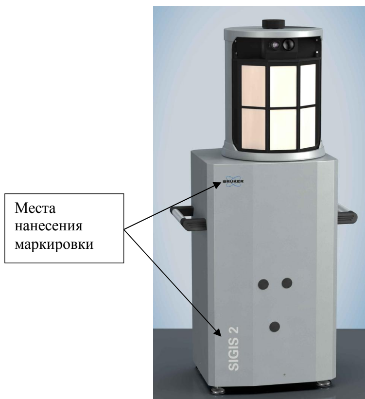
Рисунок 1 – Общий вид Фурье-спектрометра инфракрасного SIGIS 2

Схема пломбировки от несанкционированного доступа представлена на рисунке 2.