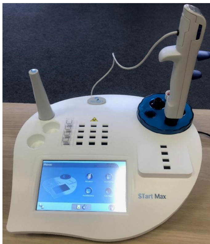
Рисунок 1 – Общий вид анализаторов полуавтоматических STart Max с принадлежностями

Схема пломбировки от несанкционированного доступа, обозначение места нанесения знака поверки представлены на рисунке 2.