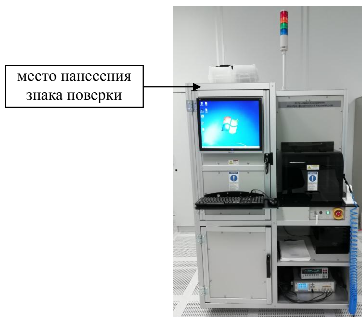
Рисунок 1 – Общий вид установки

Общий вид средства измерений представлен на рисунке 1.