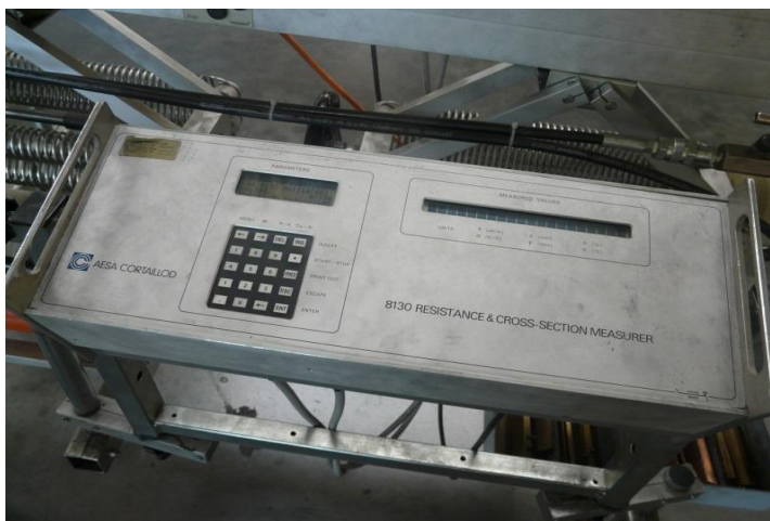
Рисунок 3 - Общий вид блока управления AESA 8130 (лицевая панель)