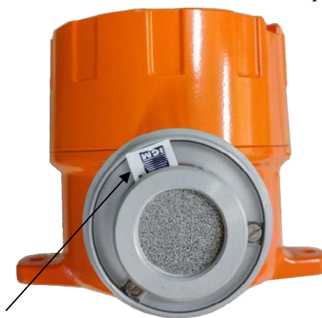
Место нанесения пломбы