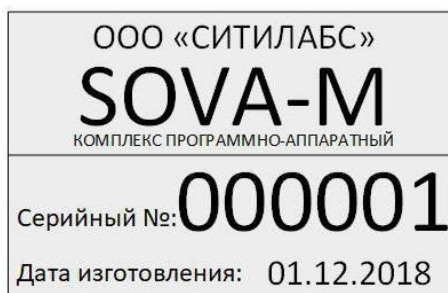
Рисунок 2 - Общий вид маркировки комплексов