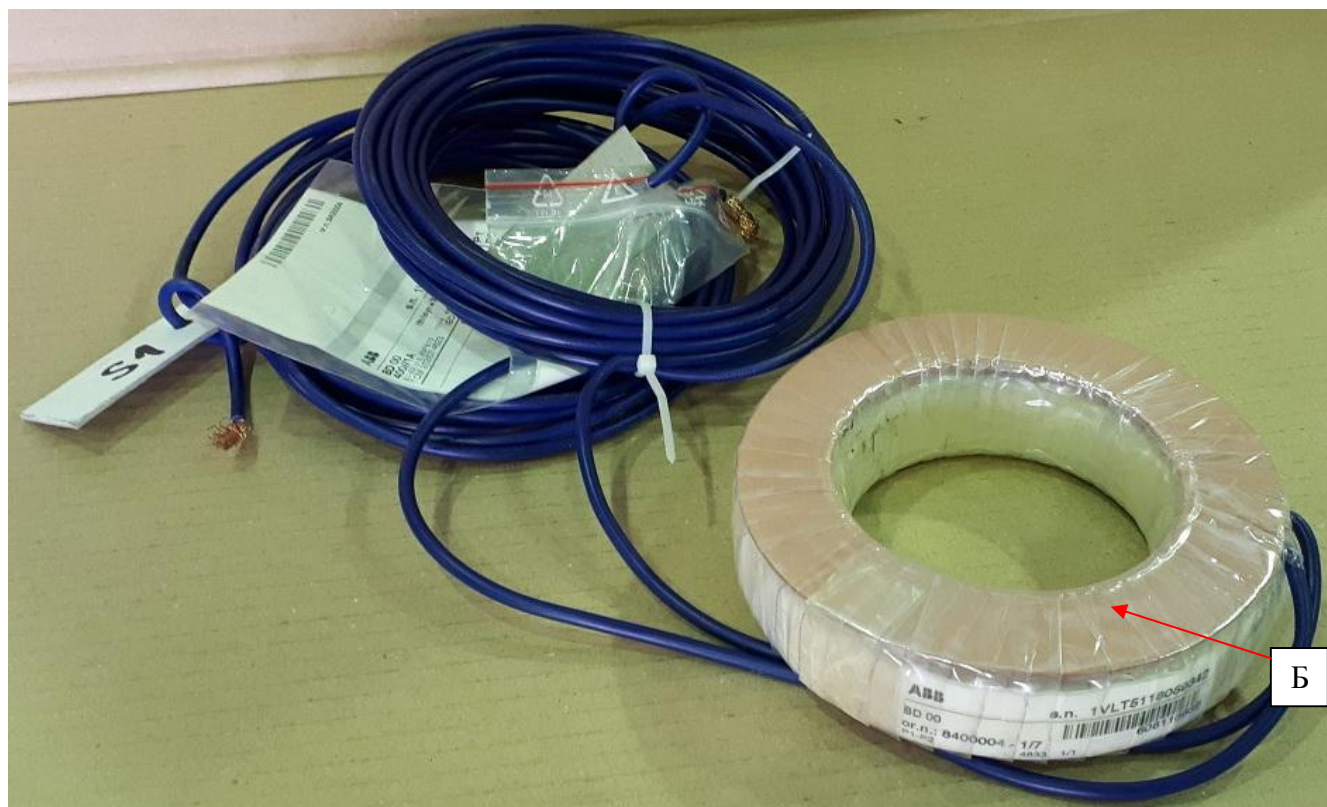
Модификация BD 00 0

Рисунок 1 - Общий вид средства измерений и обозначение места пломбировки от несанкционированного доступа (А) и места нанесения знака поверки (Б)