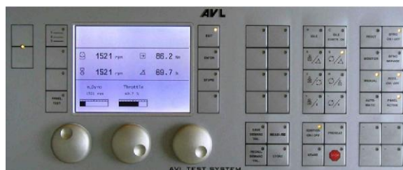
Рисунок 2 - Общий вид пульта управления