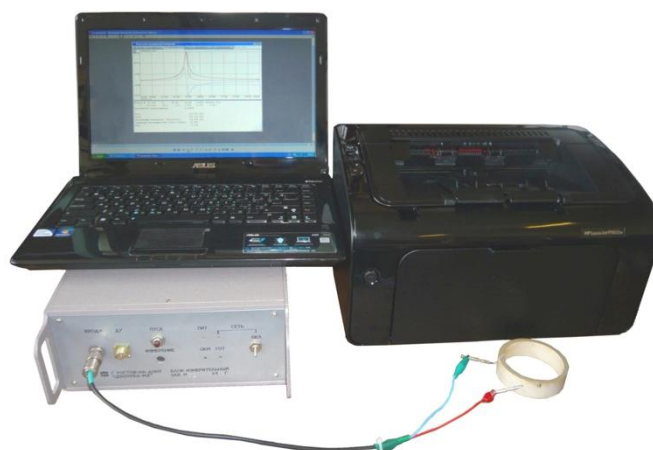
Рисунок 2 - Общий вид аппаратуры для контроля параметров пьезоэлементов «Цензурка-МА2.1»

Схема пломбировки от несанкционированного доступа, обозначение места нанесения знака поверки представлены на рисунке 3.