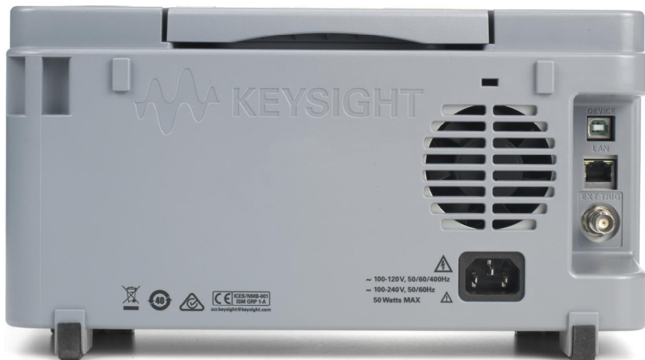
Рисунок 2 – Общий вид осциллографов цифровых DSOX1204G. Вид сзади