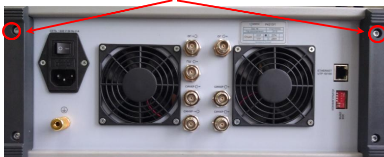
Рисунок 3– Внешний вид анализатора цепей векторного (задняя панель)

Место для пломбирования от несанкционированного доступа