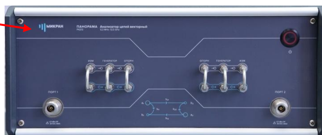
б) P4213/3, P4213/4, P4213/5, P4213/6