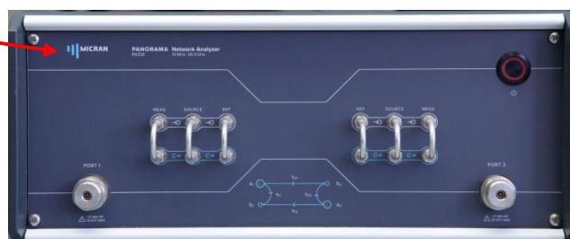
б) P4226/2, P4226/3, P4226/4, P4226/5