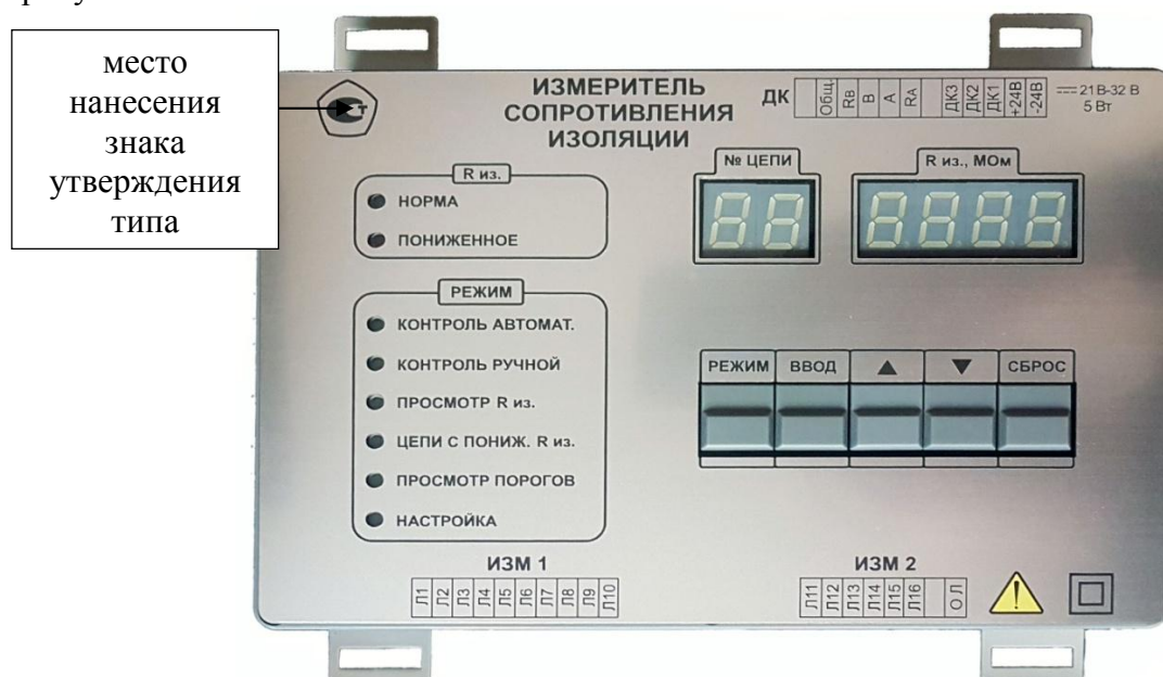
Рисунок 1 – Общий вид средства измерений

Схема пломбировки измерителей от несанкционированного доступа представлена на рисунке 2.