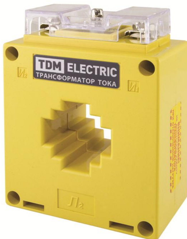
Рисунок 9 – Общий вид трансформаторов тока ТТН желтого цвета (исполнение «color»)