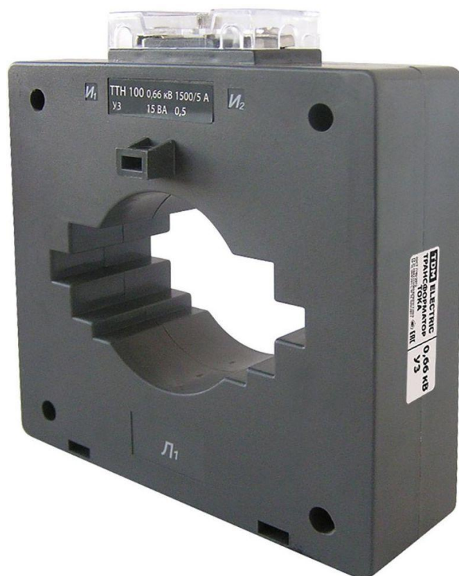
Рисунок 7 – Общий вид трансформаторов тока ТТН 100