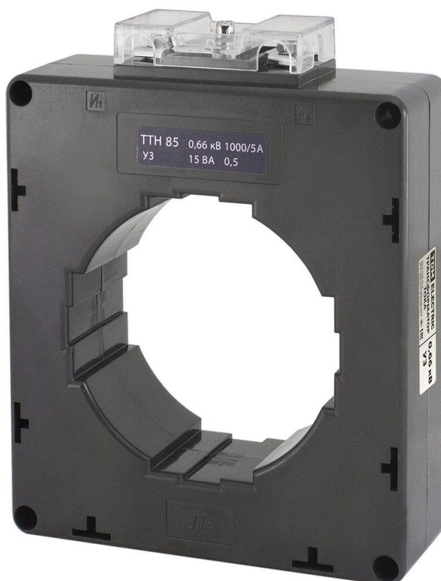
Рисунок 6 – Общий вид трансформаторов тока ТТН 85