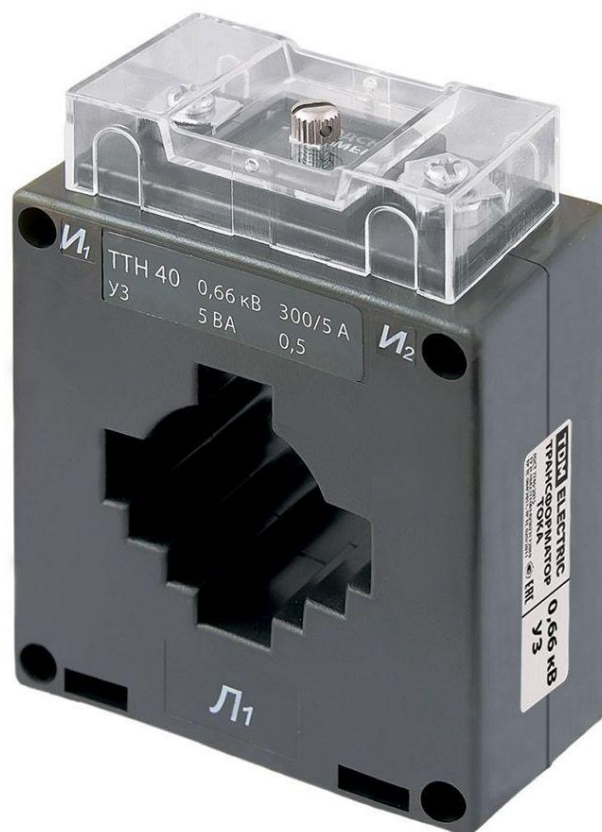
Рисунок 4 – Общий вид трансформаторов тока ТТН 40