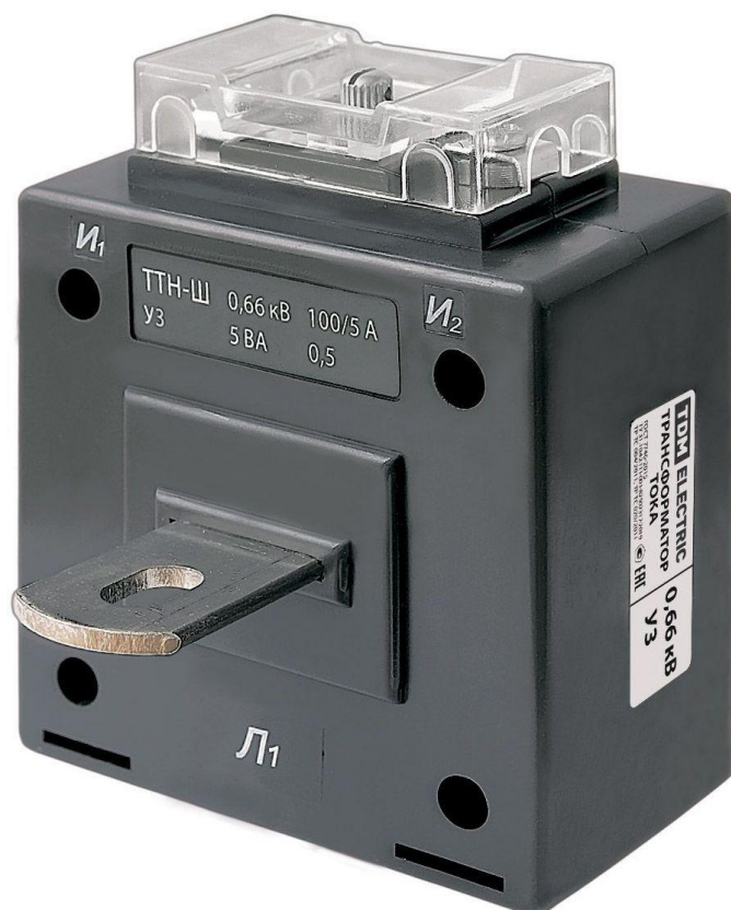
Рисунок 1 – Общий вид трансформаторов тока ТТН-Ш