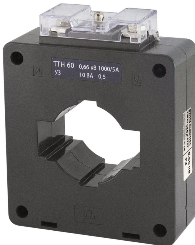
Рисунок 5 – Общий вид трансформаторов тока ТТН 60