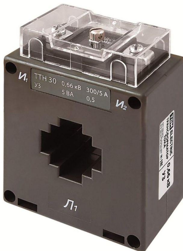
Рисунок 2 – Общий вид трансформаторов тока ТТН 30