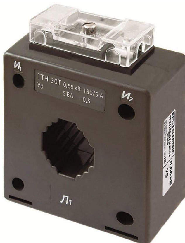
Рисунок 3 – Общий вид трансформаторов тока ТТН 30Т