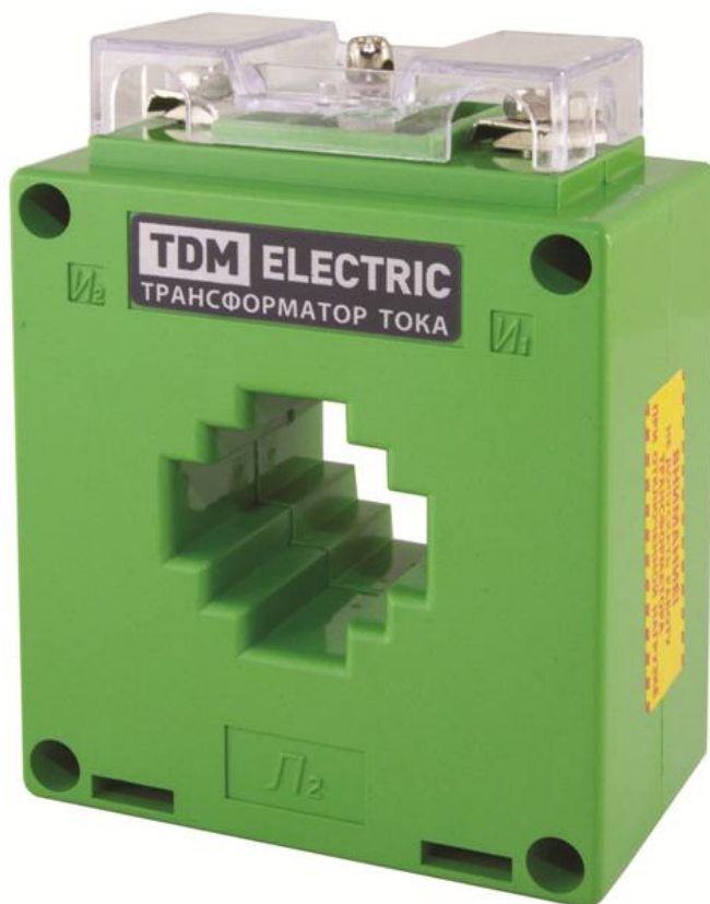
Рисунок 10 – Общий вид трансформаторов тока ТТН зеленого цвета (исполнение «color»)