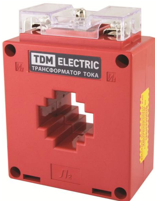
Рисунок 11 – Общий вид трансформаторов тока ТТН красного цвета (исполнение «color»)