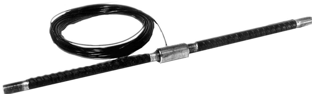
Рисунок 2 – Общий вид датчиков

Общий вид датчиков приведен на рисунке 2.