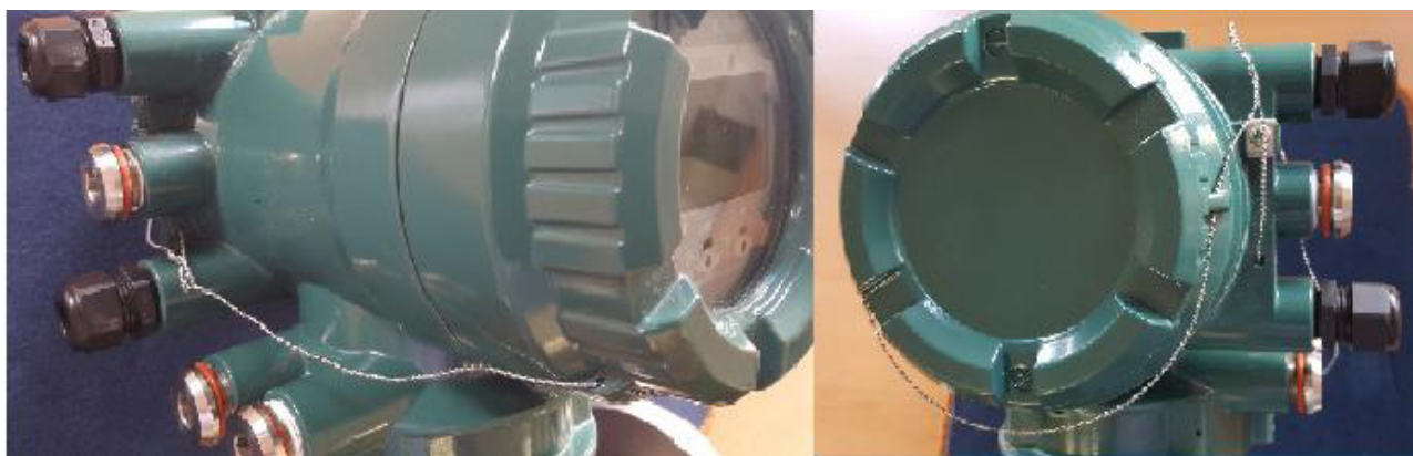
Рисунок 2 – схема пломбировки от несанкционированного доступа