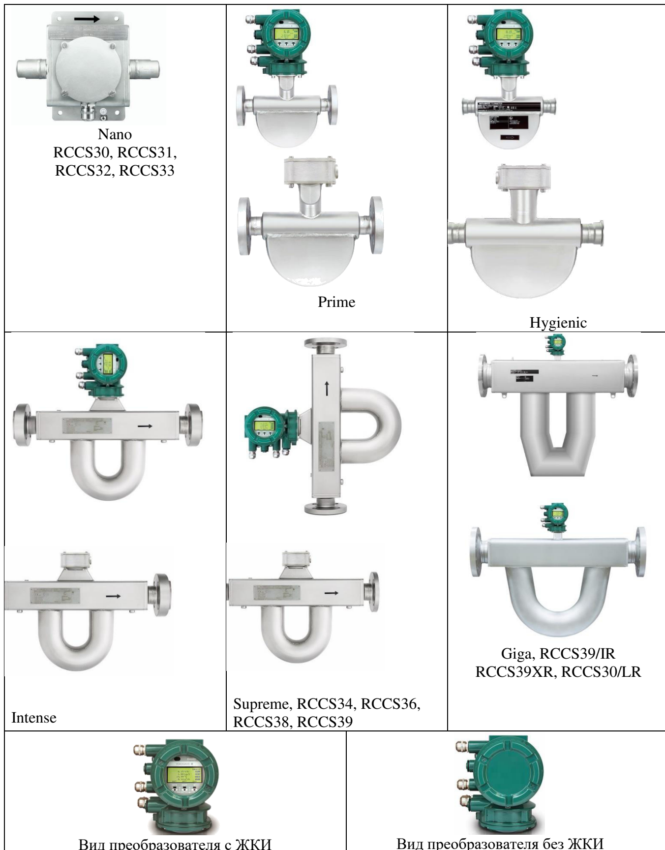
Рисунок 1 - Общий вид расходомеров-счетчиков массовых кориолисовых ROTAMASS RC