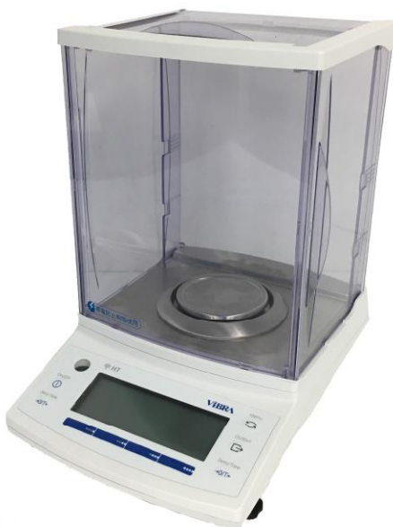
Рисунок 1 – Общий вид весов неавтоматического действия НТ

Принцип действия весов основан на преобразовании изменения частоты вибрации акустического весоизмерительного датчика, возникающего при его деформации под действием силы тяжести объекта измерений, в цифровой электрический сигнал, изменяющийся пропорционально массе объекта измерений.