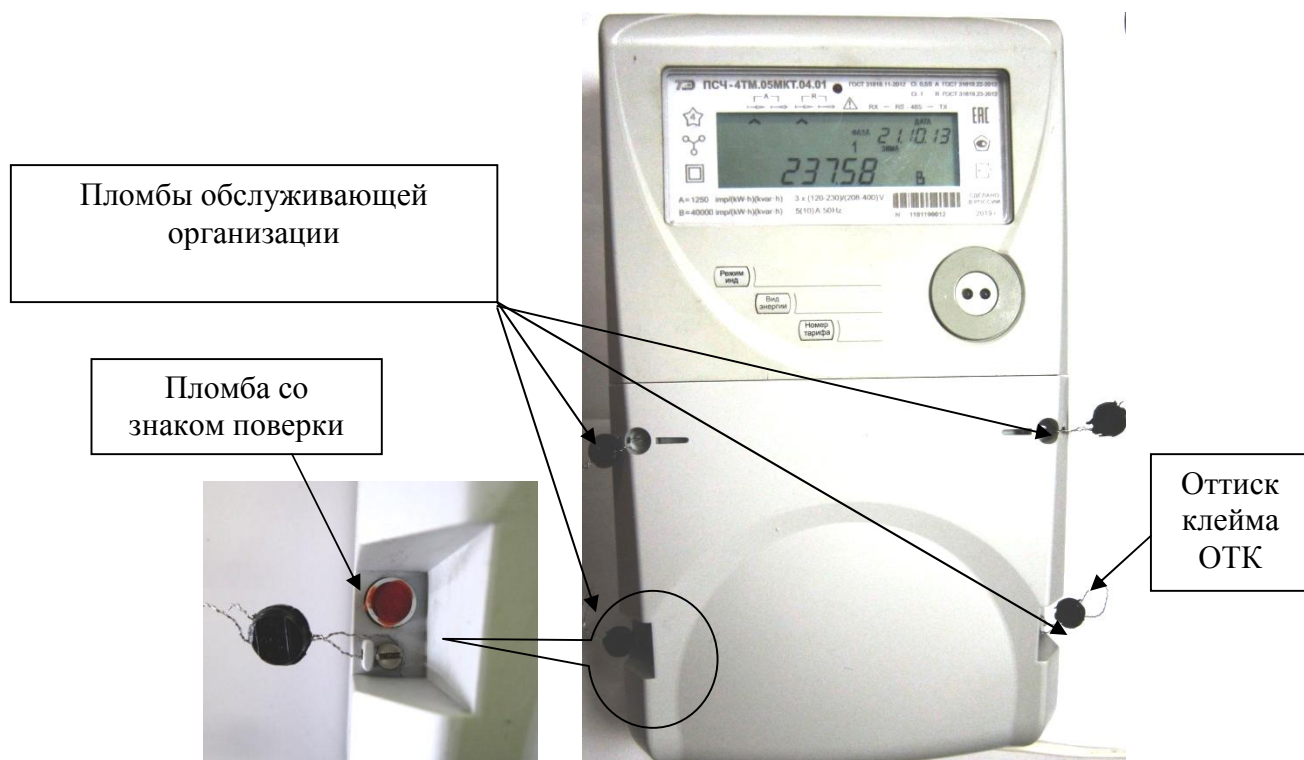
Рисунок 1 – Общий вид счетчика, схема пломбирования от несанкционированного доступа, обозначение места нанесения знака поверки

Из четырех пломб обслуживающей организации могут устанавливаться только две, но обязательно слева и справа.