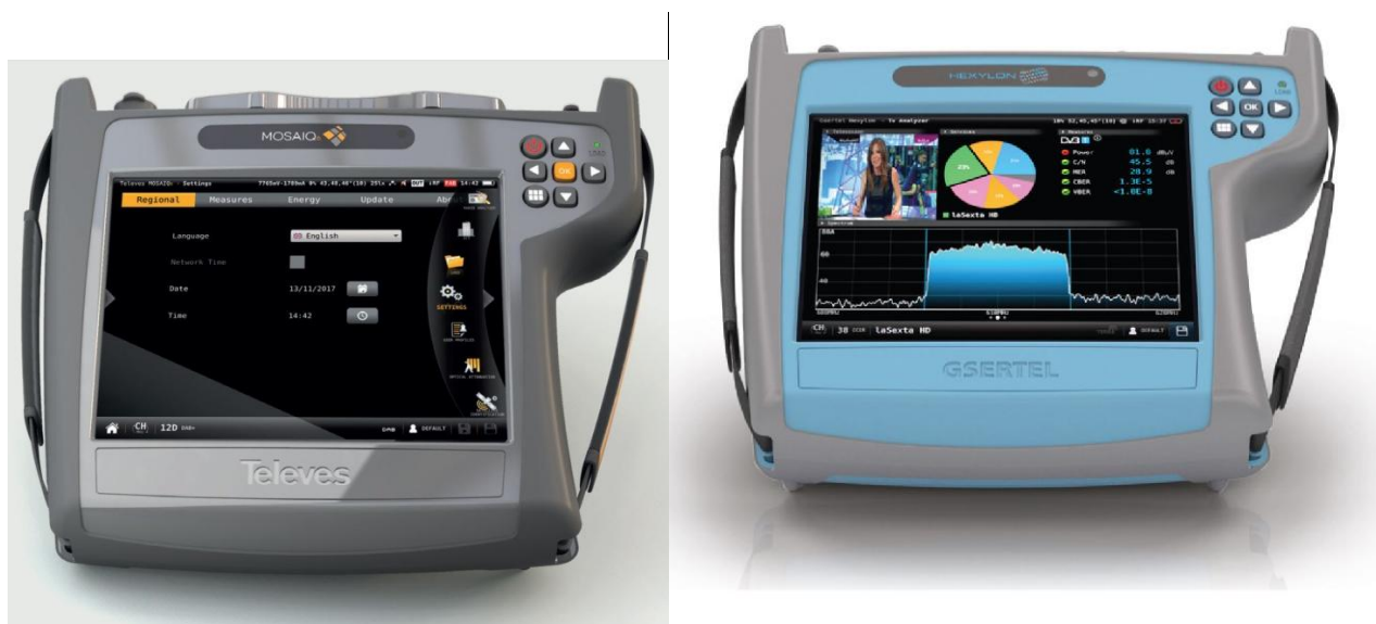
Рисунок 2 – Общий вид анализаторов MOSAIQ и HEXYLON