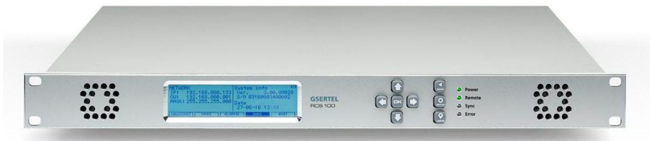
Рисунок 1 – Общий вид анализаторов RCS 50, RCS 100, RCS 400

Общий вид анализаторов, места заводской пломбировки и обозначение места нанесения знака утверждения типа представлены на рисунках 1, 2, 3.