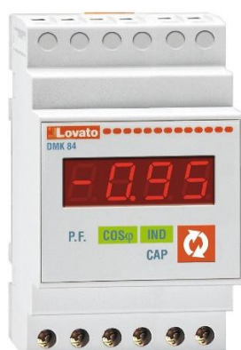
Рисунок 23 – Общий вид приборов серии DMK модификации DMK 84