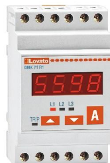
Рисунок 28 – Общий вид приборов серии DMK модификации DMK 71 R1