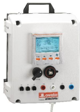
Рисунок 5 – Общий вид приборов серии DMG модификации DMG M3 900 01