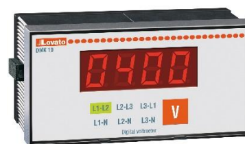
Рисунок 12 – Общий вид приборов серии DMK модификаций DMK 10, DMK 10 R1, DMK 11, DMK 11 R1, DMK 15, DMK 15 R1