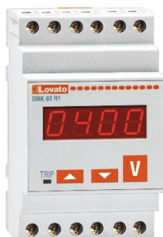
Рисунок 17 – Общий вид приборов серии DMK модификации DMK 80 R1