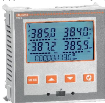
Рисунок 9 – Общий вид приборов серии DMG модификации DMG 611 R 0100