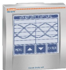
Рисунок 7 – Общий вид приборов серии DMG модификации DMG 900RD