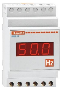
Рисунок 21 – Общий вид приборов серии DMK модификации DMK 83