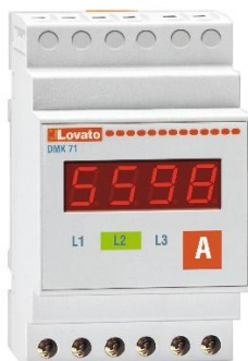
Рисунок 27 – Общий вид приборов серии DMK модификации DMK 71