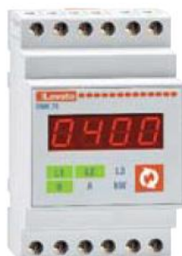
Рисунок 29 – Общий вид приборов серии DMK модификации DMK 75