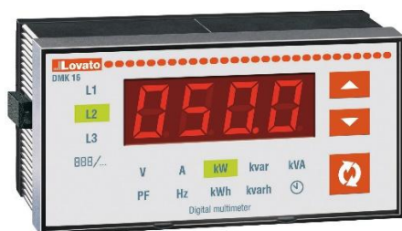
Рисунок 13 – Общий вид приборов серии DMK модификации DMK 16