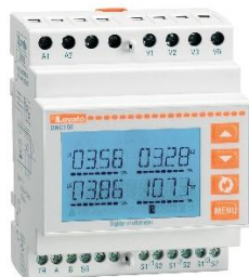
Рисунок 1 – Общий вид приборов серии DMG модификаций DMG 100, DMG 110

Общий вид приборов серии DMK приведен на рисунках 11-29.