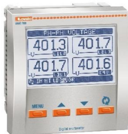
Рисунок 3 – Общий вид приборов серии DMG модификаций DMG 700, DMG 700 L01, DMG 800, DMG 800 L01, DMG 800 D048