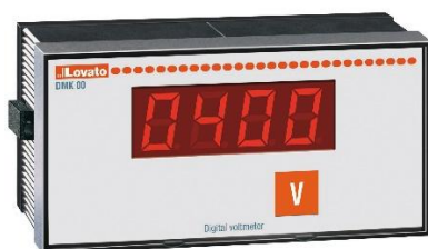
Рисунок 11 – Общий вид приборов серии DMK модификаций DMK 00, DMK 00 R1, DMK 01, DMK 01 R1, DMK 02, DMK 03, DMK 03 R1, DMK 04, DMK 04 R1