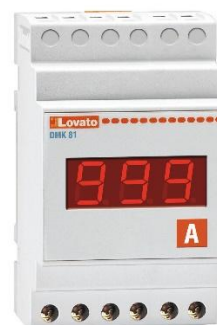
Рисунок 18 – Общий вид приборов серии DMK модификации DMK 81