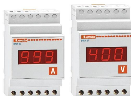
Рисунок 20 – Общий вид приборов серии DMK модификации DMK 82