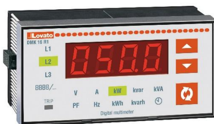
Рисунок 15 – Общий вид приборов серии DMK модификации DMK 16 R1