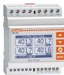
Рисунок 2 – Общий вид приборов серии DMG модификаций DMG 200, DMG 200 L01, DMG 210, DMG 210 L01, DMG 300, DMG 300 L01