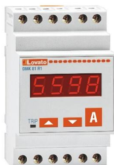
Рисунок 19 – Общий вид приборов серии DMK модификации DMK 81 R1