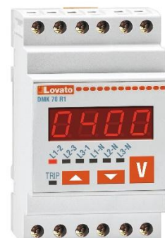
Рисунок 26 – Общий вид приборов серии DMK модификации DMK 70 R1