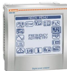
Рисунок 4 – Общий вид приборов серии DMG модификаций DMG 900, DMG 900 L01, DMG 900 D048