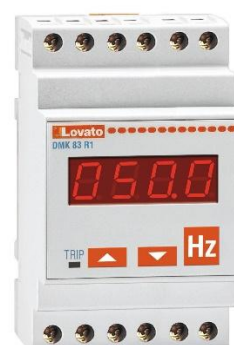
Рисунок 22 – Общий вид приборов серии DMK модификации DMK 83 R1