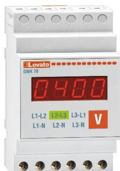
Рисунок 25 – Общий вид приборов серии DMK модификации DMK 70