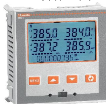
Рисунок 8 – Общий вид приборов серии DMG модификаций DMG 600, DMG 610