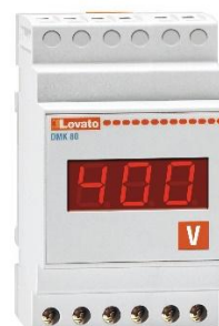
Рисунок 16 – Общий вид приборов серии DMK модификации DMK 80