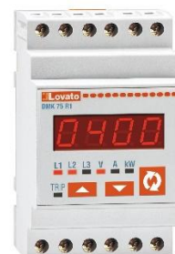
Рисунок 30 – Общий вид приборов серии DMK модификации DMK 75 R1

Пломбирование приборов серии DMK не предусмотрено.