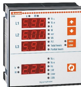
Рисунок 14 – Общий вид приборов серии DMK модификаций DMK 20, DMK 22