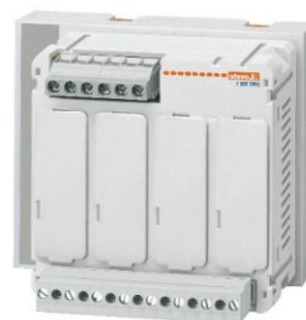
Рисунок 6 – Общий вид приборов серии DMG модификаций DMG 900T, DMG 900T D048