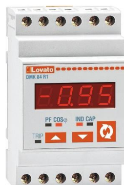
Рисунок 24 – Общий вид приборов серии DMK модификации DMK 84 R1