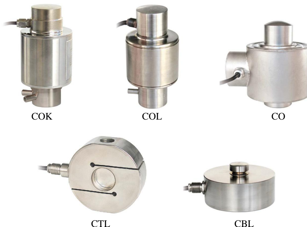
Рисунок 1 – Общий вид датчиков весоизмерительных тензорезисторных СО, СВЛ, СОК, СОЛ, СТЛ

Общий вид датчиков представлен на рисунке 1.