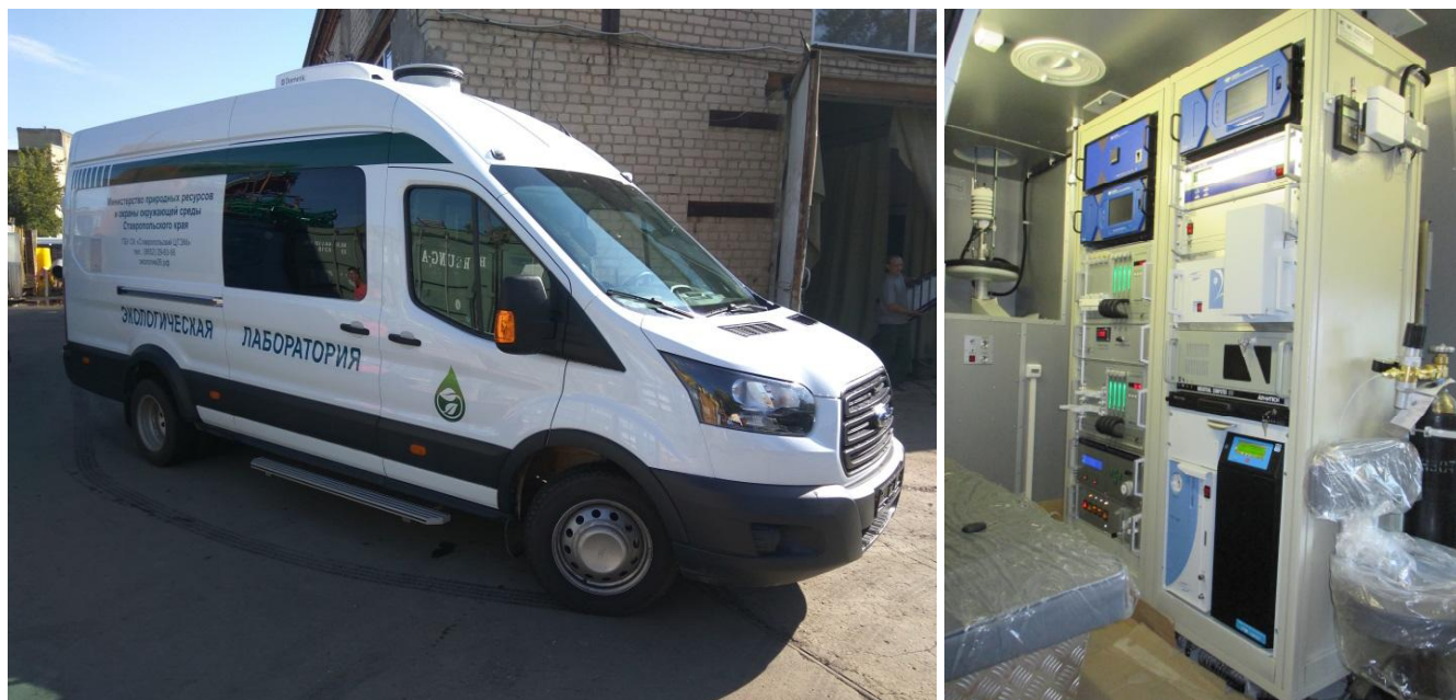
Рисунок 2 – Общий вид комплекса в исполнении для ПЭП