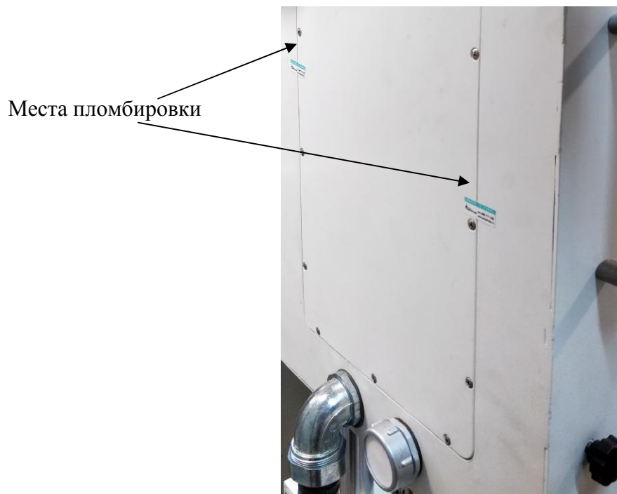
Рисунок 2 – Схема пломбировки от несанкционированного доступа