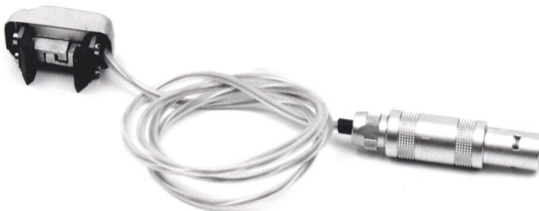
Рисунок 1 - Внешний вид датчиков перемещений (деформаций) ЕХА 10-0,5х, ЕХА 25-1,25х

Общий вид датчиков приведен на рисунках 1 – 3.