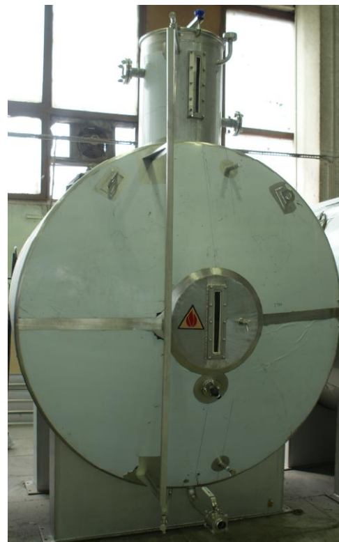
в) горизонтальный полной вместимости