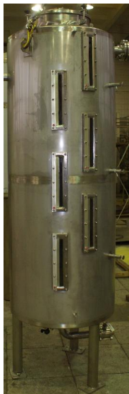
а) вертикальный шкальный

Схема пломбировки от несанкционированного доступа, обозначение места нанесения знака поверки представлены на рисунке 2.