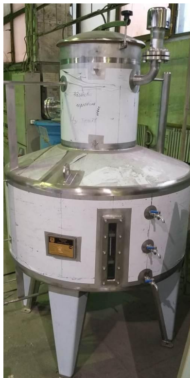
б) вертикальный полной вместимости