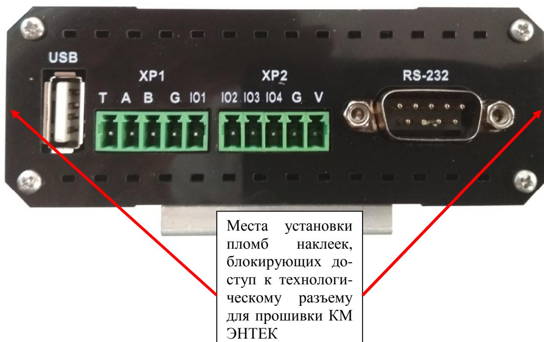
Рисунок 4 – Места установки пломб наклеек, вид сзади