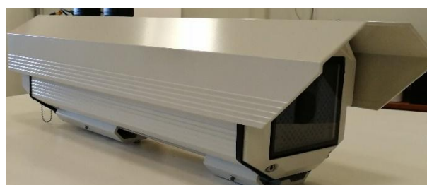
РТС с индексом «К», «КВ»