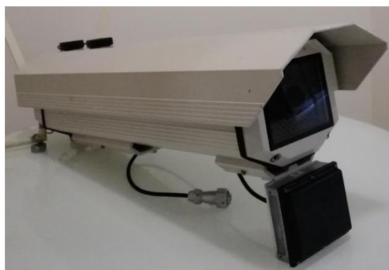
РТС с индексом «КР»

Места пломбирования, маркировки и нанесения знака утверждения типа приведены на рисунках 2 и 3.