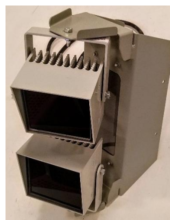
Внешний ИК прожектор