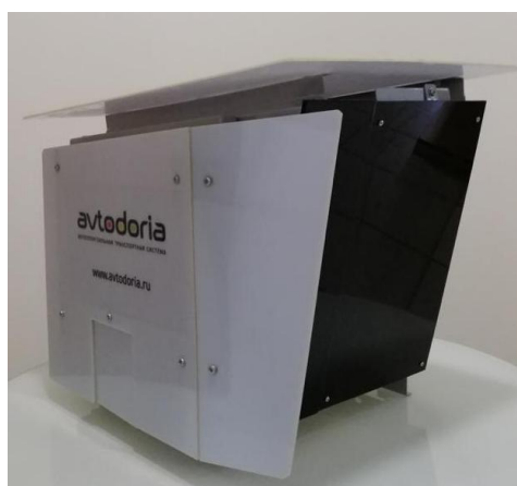
РТС с индексом «МВ»