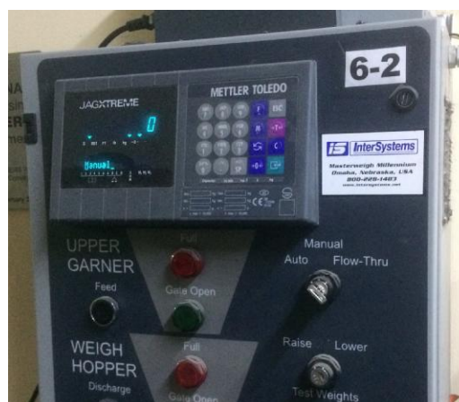
Рисунок 2 - Внешний вид панели управления дозатора