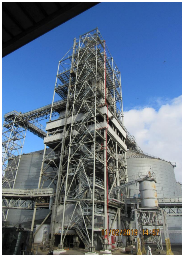
б – фото дозатора