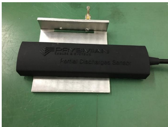
Рисунок 2 – Общий вид измерительных датчиков Pry-Cam Wings