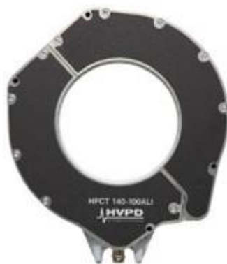
Рисунок 3 - Общий вид измерительных датчиков HFCT (опция)