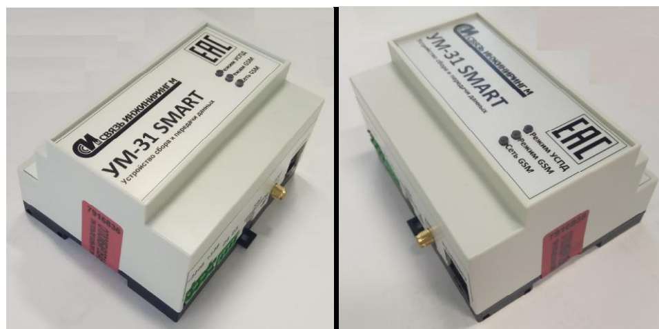
Рисунок 2 – Места нанесения пломбирочных наклеек на боковые поверхности устройства