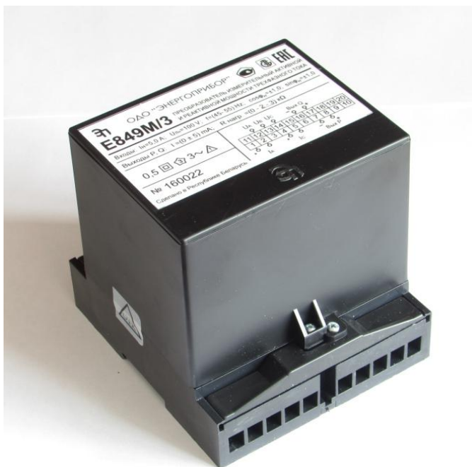
Рисунок 1 - Общий вид ИП