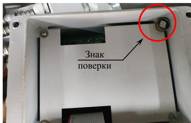
Рисунок 8 – Схема пломбировки ПРЭ