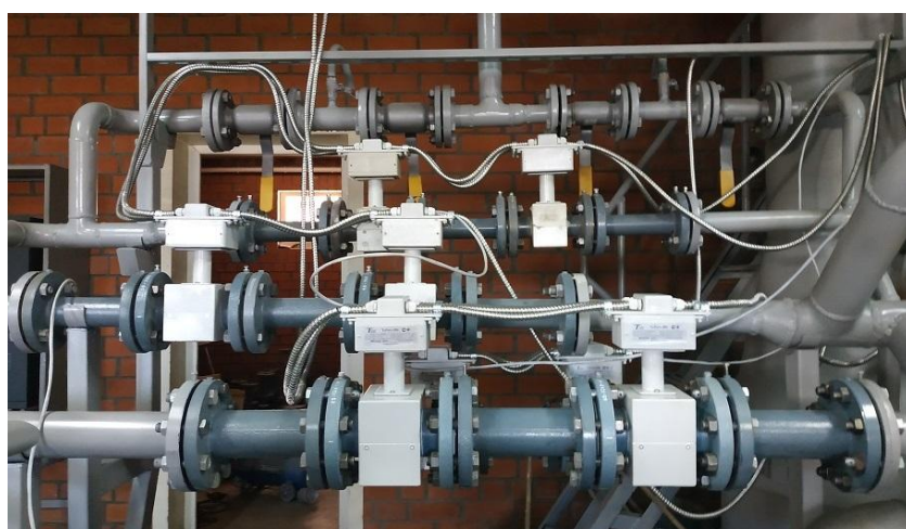
д) Преобразователи расхода ПРЭ