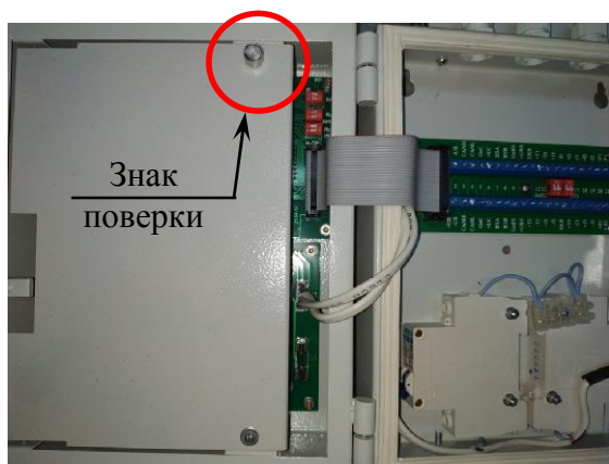
Рисунок 7 – Схема пломбировки СОИ

Так же предусмотрена пломбировка для предотвращения разборки прямых участков преобразователей расхода ПРЭ. Схемы пломбировки прямых участков и самих ПРЭ при помощи пломбы представлены на рисунках 8 и 9.