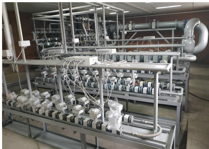
а) Установка поверочная расходомерная ТеРосс-УПР

Общий вид средства измерений приведен на рисунке 1.