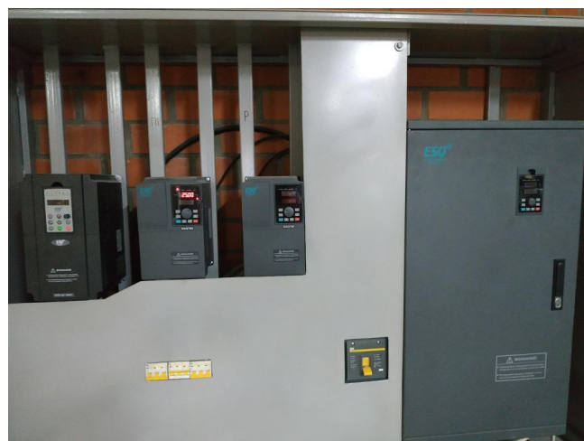
г) Узел частотных регуляторов