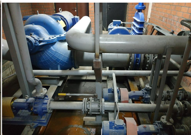
б) Насосная группа