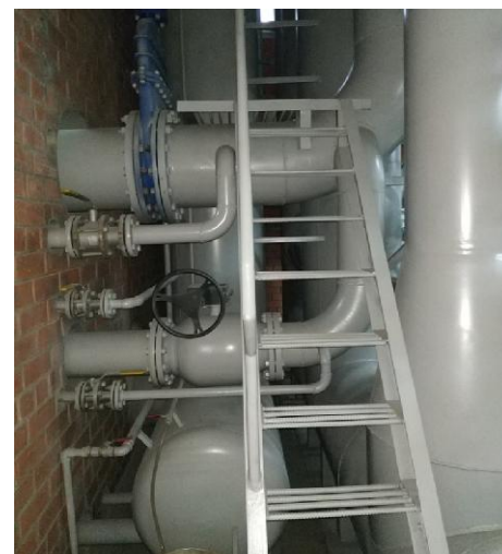
е) Демпферные емкости