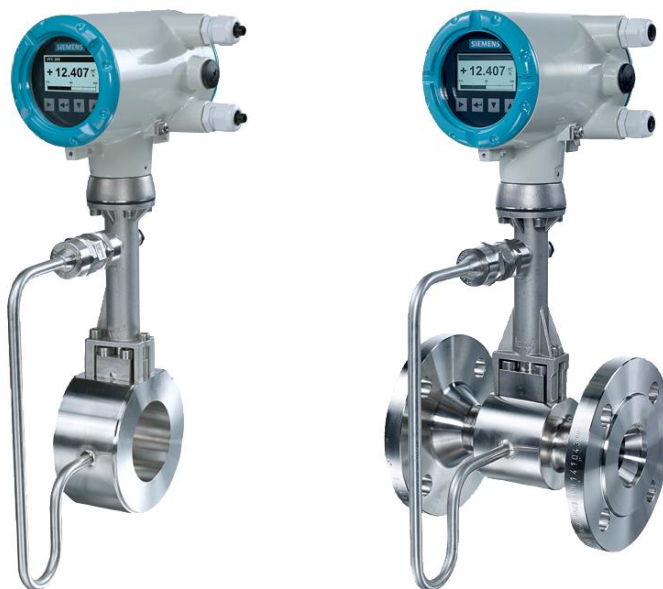
Рисунок 1 - Общий вид расходомера SITRANS FX 330 (показаны различные виды присоединения, слева «сэндвич», справа-фланцевый)