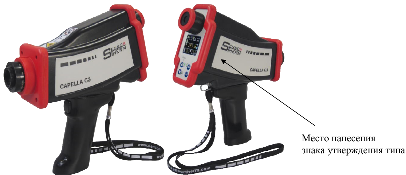
Рисунок 1 - Общий вид средства измерений

Общий вид средства измерений представлен на рисунке 1.