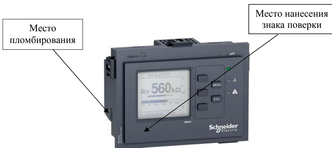
б) модификации IM400, IM400L, IM400C, IM400THR, IM400LTHR