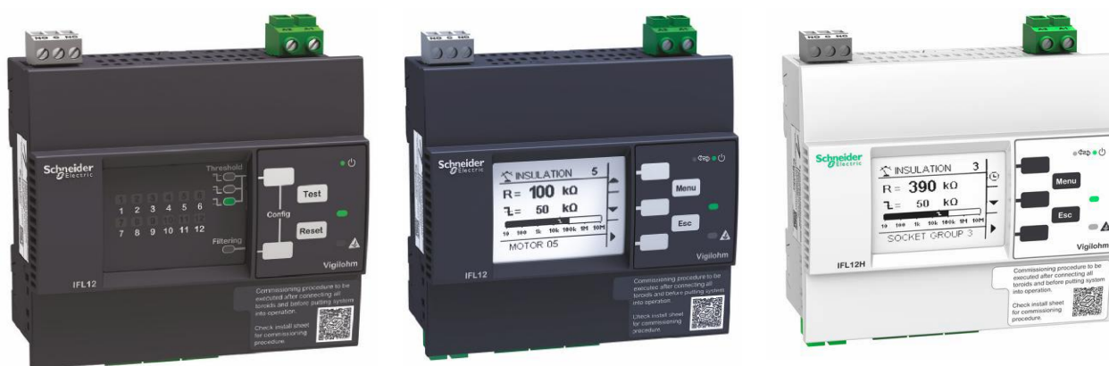
а) модификации IFL12, IFL12L