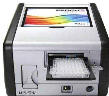
Рисунок 2 - Общий вид спектрофотометров EPOCH2T, EPOCH2TC