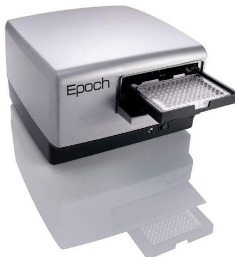
Рисунок 1 - Общий вид спектрофотометров ЕРОСН

Общий вид спектрофотометров представлен на рисунках 1 - 4.