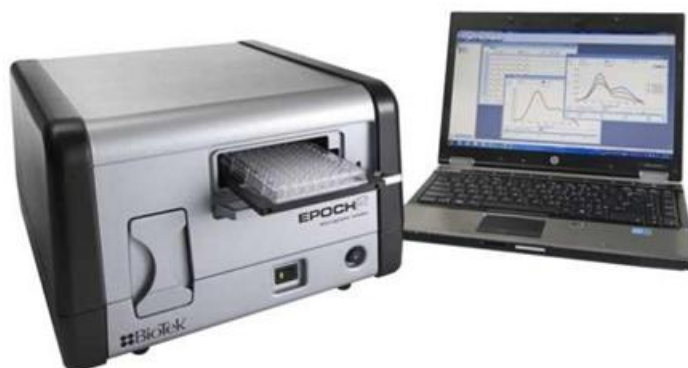
Рисунок 4 - Общий вид спектрофотометров EPOCH2, EPOCH2C, EPOCH2NS, EPOCH2NSC

Схема маркировки спектрофотометров представлена на рисунке 5.