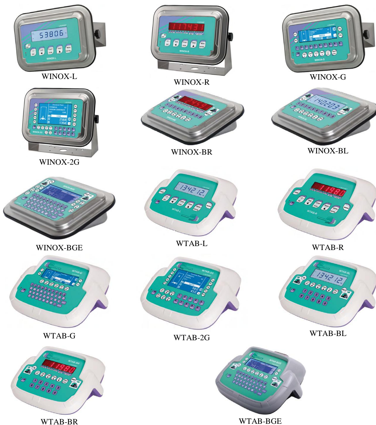
Рисунок 2 – Общий вид приборов

Принцип действия приборов основан на измерении аналогового электрического сигнала от весоизмерительных датчиков. Этот сигнал усиливается, затем с помощью АЦП, преобразуется в цифровой, далее обрабатывается микропроцессором. Измеренное значение массы выводится на дисплей и/или передается через цифровые интерфейсы на внешние периферийные устройства. Приборы могут быть оснащены интерфейсами связи: RS232, RS485, USB, Ethernet TCP/IP, WiFi, Modbus RTU, Profibus, DeviceNet, CANopen, Ethernet/IP, Modbus/TCP, Profinet IO, EtherCAT, Powerlink, SercosIII, CC-link, аналоговые входы и выходы.