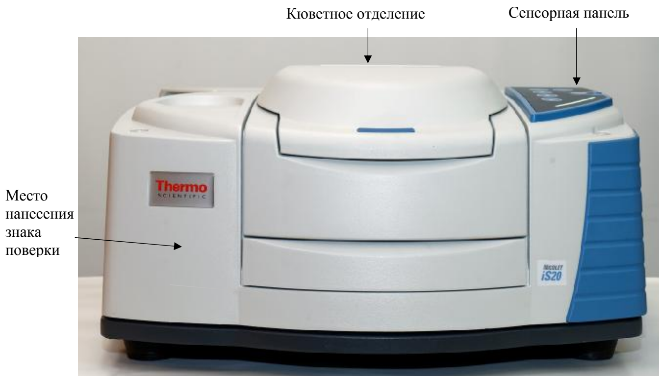
Рисунок 1 - Общий вид спектрометров, обозначение места нанесения знака поверки