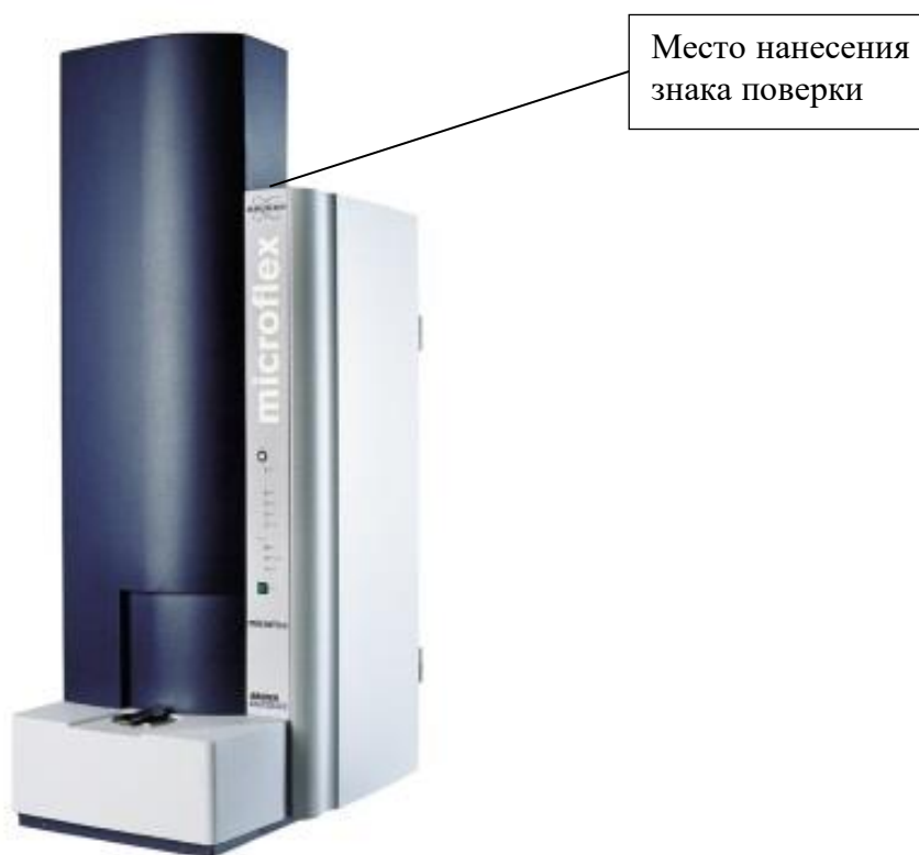
Рисунок 2 - Общий вид масс-спектрометров microflex LRF