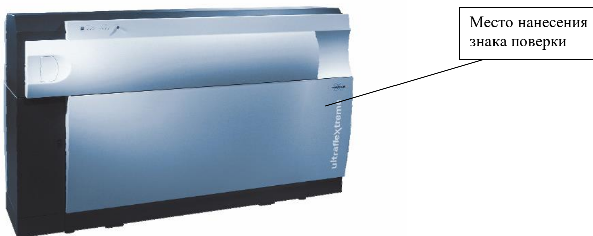
Рисунок 4- Общий вид масс-спектрометров ultrafleXtreme