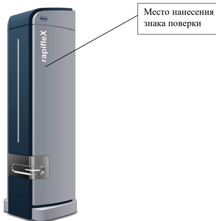
Рисунок 5- Общий вид масс-спектрометров rapifleX MALDI TOF MS, rapifleX MALDI TOF/TOF