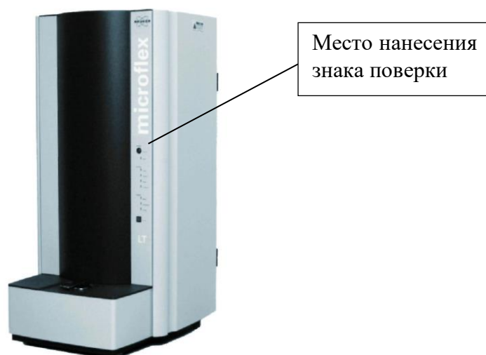
Рисунок 1 - Общий вид масс-спектрометра microflex LT/SH