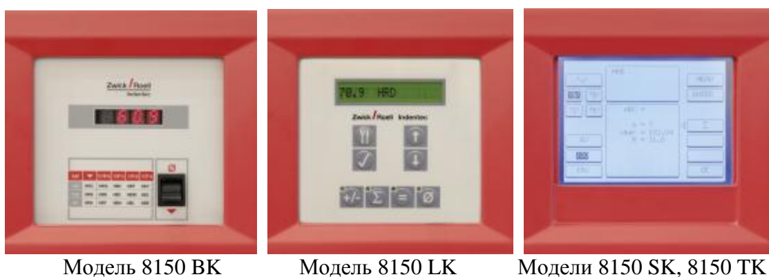
Рисунок 3 – Общий вид дисплея твердомеров